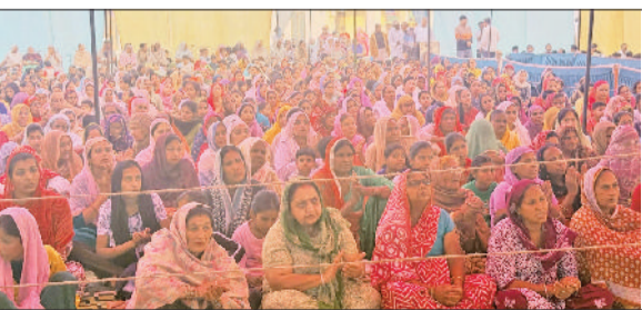
भूना। श्री राम कथा के तीसरे दिन उपस्थित महिला श्रद्धालुगण, प्रवचन सुनती हुई