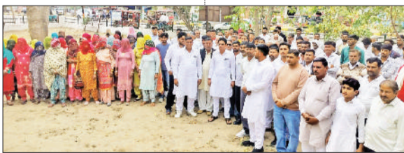
फतेहाबाद। डीसी से मिलने पहुंचे गांव खाराखेड़ी के ग्रामीण।