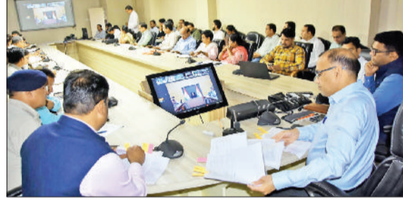
फतेहाबाद। बैठक को संबोधित करते डीसी डॉ. विवेक भारती।

2025 की सभी लंबित शिकायतों का आगामी 15 दिनों के अंदर निपटान सुनिश्चित कर उसकी रिपोर्ट उपत्युक्त कार्यालय को भेजी जाए