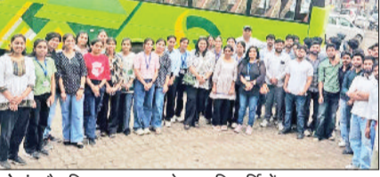
ओढ़ा। शैक्षणिक भ्रमण करने गया विद्यार्थियों का दल।

है। हमारे शिक्षकों ने विद्यार्थियों को परीक्षा के स्तर के अनुरूप तैयार किया, जिसका फल आज सबके सामने है। मुख्य शिक्षक ने इस अवसर पर ग्रामवासियों से अपील करते हुए कहा कि सरकारी स्कूलों में आज निजी स्कूलों से बेहतर सुविधाएं और योग्य शिक्षक मौजूद हैं। उन्होंने अभिभावकों को प्रोत्साहित किया कि वे अपने बच्चों का अधिक से अधिक दाखिला सरकारी स्कूल में करवाएं ताकि उन्हें भी ऐसी उत्कृष्ट शिक्षा और बेहतर भविष्य के अवसर मिल सकें। इस उपलब्धि से पूरे गांव इंदाछोई में खुशी का माहौल है और अभिभावकों ने स्कूल स्टाफ के प्रयासों की जमकर सराहना की है।