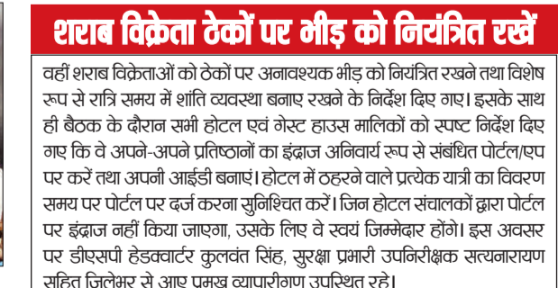
थाराब विक्रेता ठेकों पर भीड़ को नियंत्रित रखें